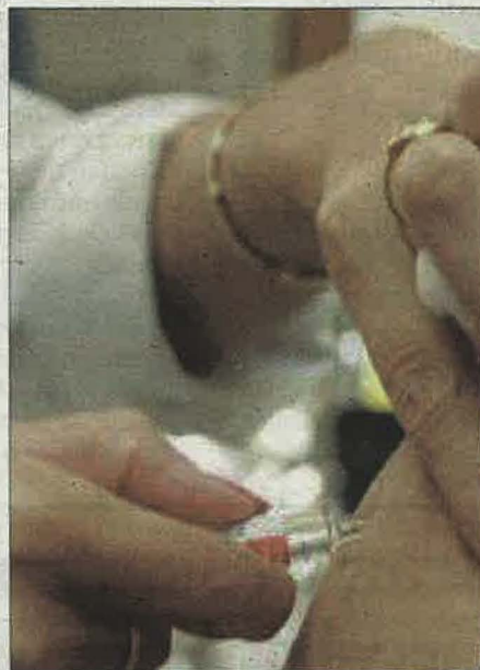
Piden más difusión sobre estas vacunas.